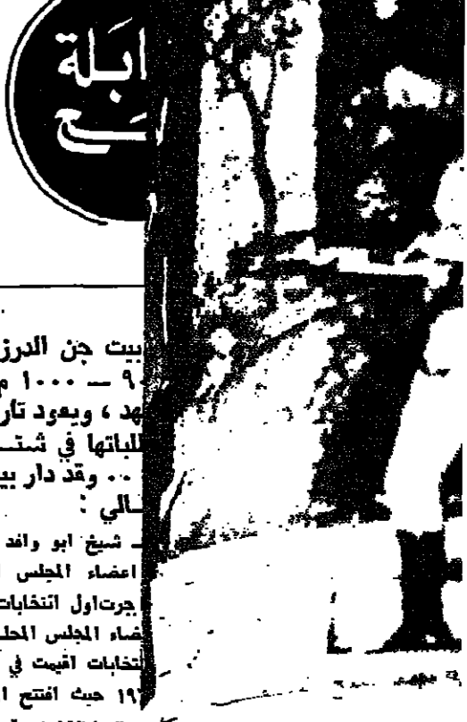
ياسمين... عضو المجلس المحلي... في انتخابات... التي أجريت... في ١٩٧٦...